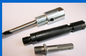
SDS-Max holder: 1JAPH004 SDS+ holder: 1JAPH002