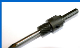
13 mm holder: 1JAPH001