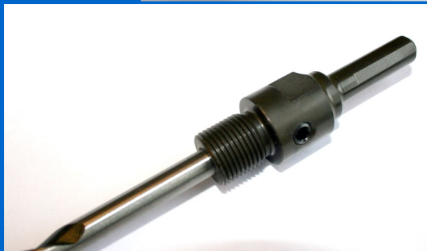
13 mm standard-holder (M18): V.nr.: 1JAPH001