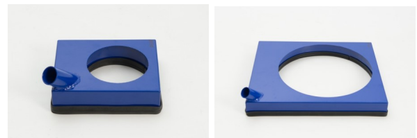
Standard firkantet model